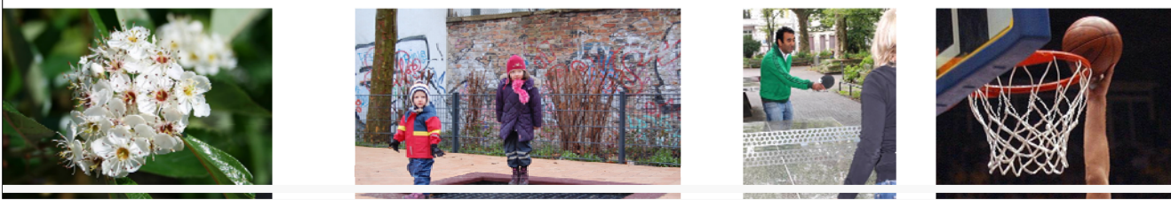
Blütenbäume Trampolin Tischtennis Basketball

Im Zuge des 3. Bauabschnittes sollen 15 Bäume entfernt werden. Diese sind teilweise durch Krankheiten geschädigt, haben geringe Entwicklungschancen oder sollen dem gewünschten lichten Charakter des neuen Gartenplatzes entsprechend gefällt werden. Die zu dicht an der Kirche stehenden Linden werden im Zuge der Sanierung des Grünbestandes beseitigt. In der gesamten Baumaßnahme werden 25 neue Bäume gepflanzt.