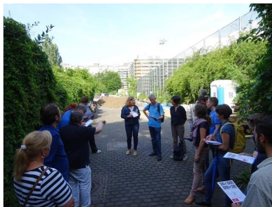
Besichtigung der Vikihaus-Baustelle mit dem Quartiersrat