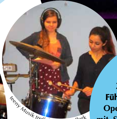
teeny Musik treff, Foto:Karin Perk

Verlosung 2 x 6 Karten für die Zauberflöte am 27.3. + Führung durch die Komische Oper! Bis 10.3. eine Postkarte mit Stichwort „Die Zauberflöte“, Name und Telefonnummer an das Familienzentrum Wattstraße