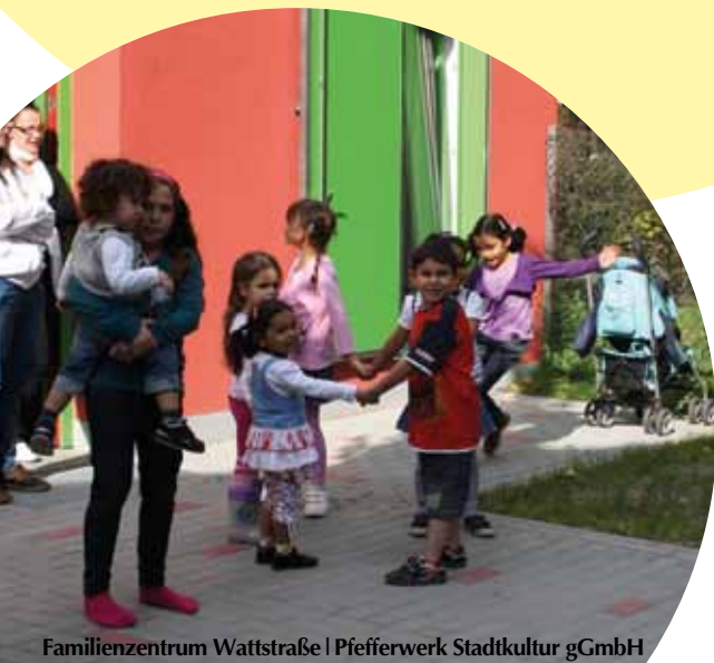
Familienzentrum Wattstraße | Pfefferwerk Stadtkultur gGmbH