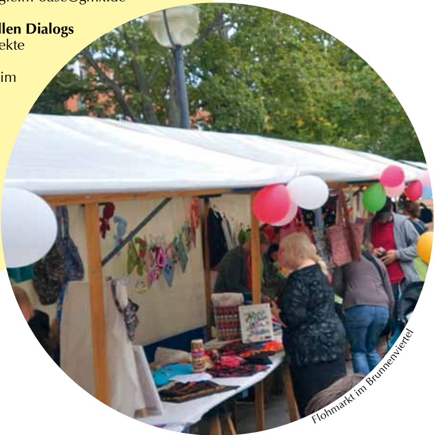
Flohmarkt im Brunnenviertel