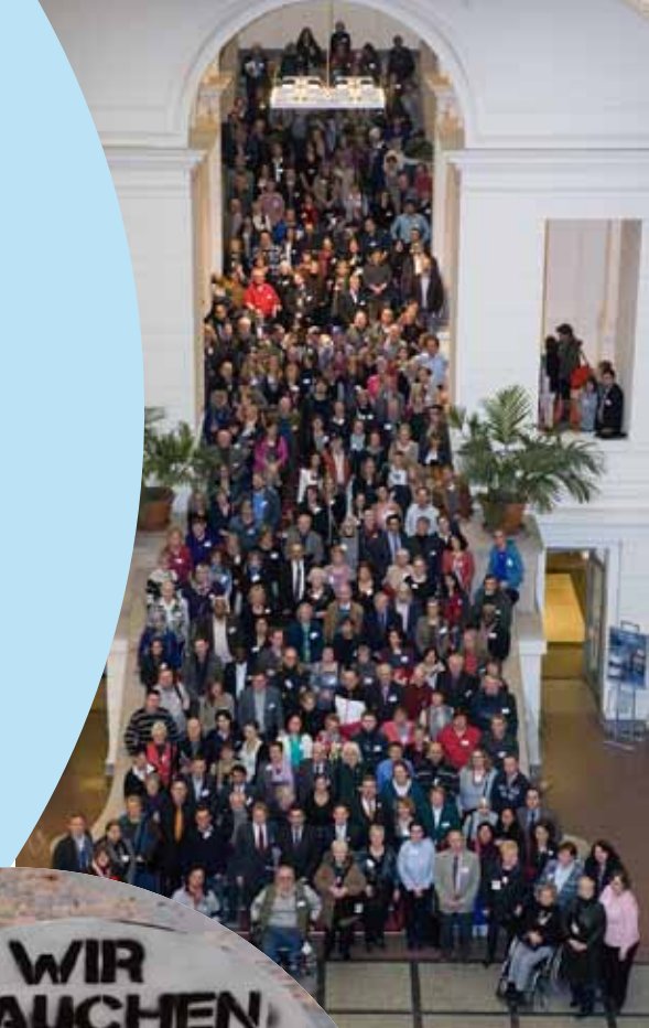
QR Kongress 2013